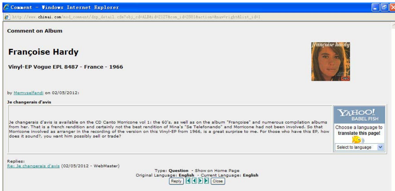
CHIMAI 网站的网友评论专栏

他的当代作品之中。一开始是听，你希望总是在它旁边。纯粹的音乐常常围绕着音乐的本质，这是它的基础，我指的是它缺乏抽象的层面。但随后，它从另一个侧面抓住了你，从音乐，从艺术的层面映射出新的内涵。如果“加布里埃尔的双簧管”（“Gabriel's oboe”）在外层使你振奋，相反“迪诺的声音”（“Suoni per Dino”）（笔者注：莫里康内 1969 年创作的一首室内乐）则深入内层使你产生冥想。“反射波”（“Come un'onda”）（笔者注：莫里康内 2006 年为音乐会所做的纯音乐）则使你意识到音乐家和他的器乐怎样能够融合到一起。莫里康内的即兴创作用新的组合揭示了声音和音乐的动态关系。